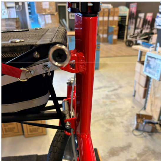
① 瓶架的组装位置 (R 或 L)。