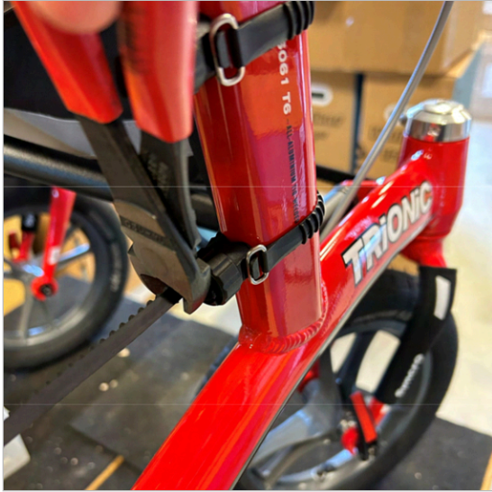
⑤ 以相同方式安装第二个支架。