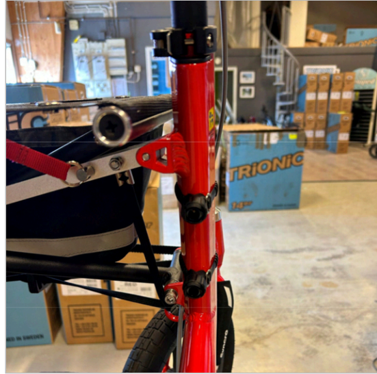
⑥ 两个支架正确组装在车架管上。