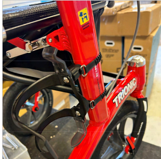
⑧ 现在，瓶架已安装到框架上，您可以从侧面放入瓶子，然后将其向外取出。