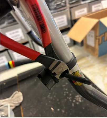
⑦ Kayışın fazla uzunluğunu kablo kesici veya bıçak yardımıyla kesin.