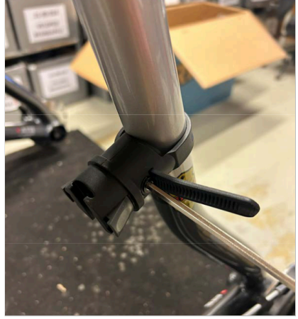
⑥ Kayış sıkılaşına kadar 4 mm'lik alyan anahtarıyla vidayı/kayı sıkın.