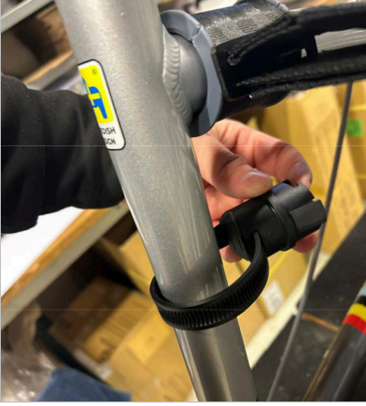
⑤ Kayışın ucunu brakete yerleştirin.