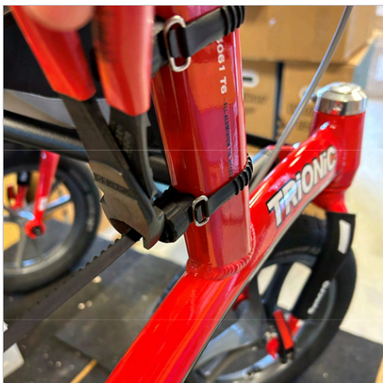
⑤ Drugi nosilec namestite na enak način.