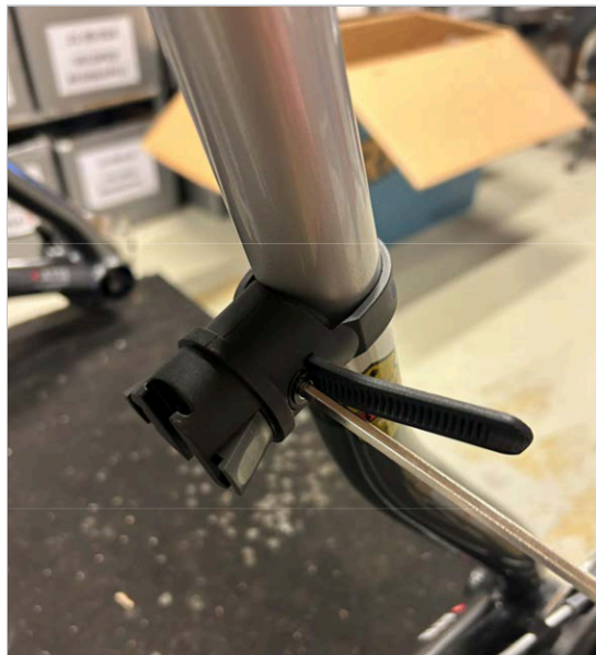
⑥ Затяните винт/ремень с помощью шестигранного ключа на 4 мм до тех пор, пока ремень не будет туго затянут.