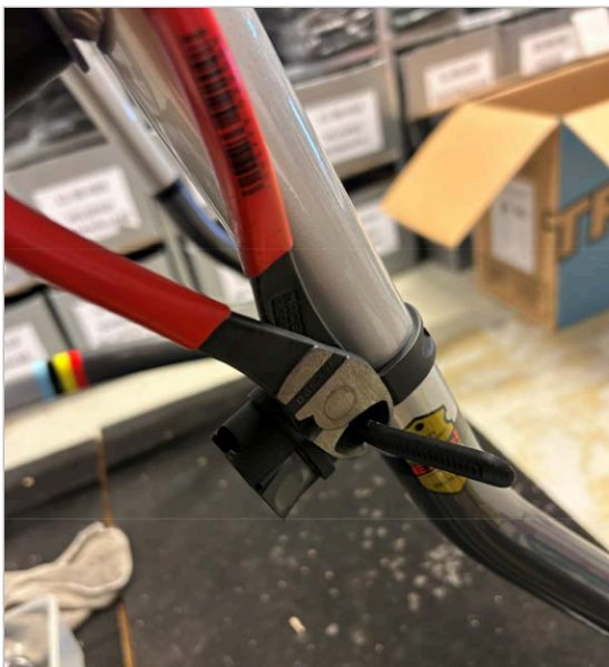
⑦ Отрежьте лишнюю длину ремня с помощью резака или ножа.