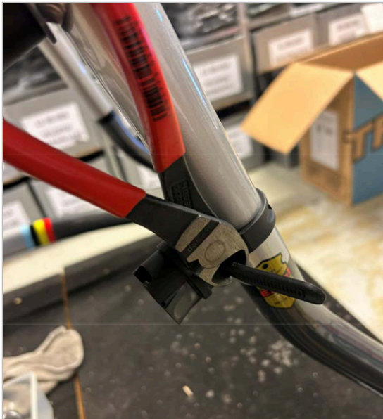
⑦ Snijd het overtollige stuk van de band af met een kabelkniptang of mes.