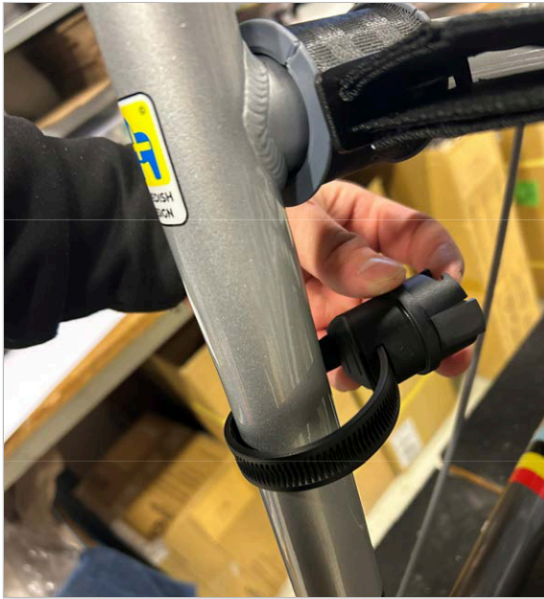
⑤ Plaats het uiteinde van de band in de beugel.