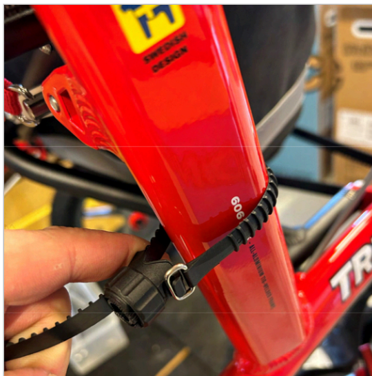
② Mähi rihtm ümber raami toru ja tõmba see läbi hoidiku.