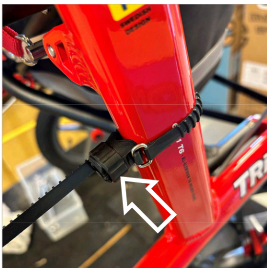
③ Tõmmake rihtm tihedalt kinni ja keerake mutrit päripäeva, et rihma pingutada.