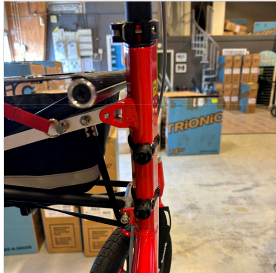
⑥ Las dos bases armadas o montadas de manera correcta en el tubo del armazón.