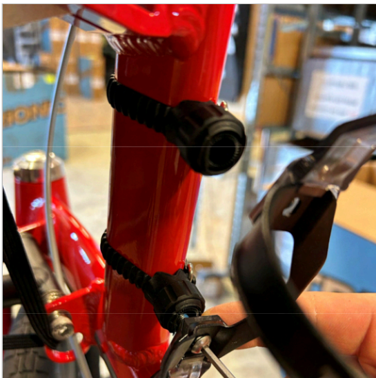
⑦ Coloque el portabotella con los dos tornillos. El "orificio" del portabotella debe estar hacia afuera.