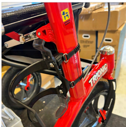
⑧ Držák na lahev je nyní připevněn k rámu a do lahve se vkládá ze strany a vyjímá se ven.